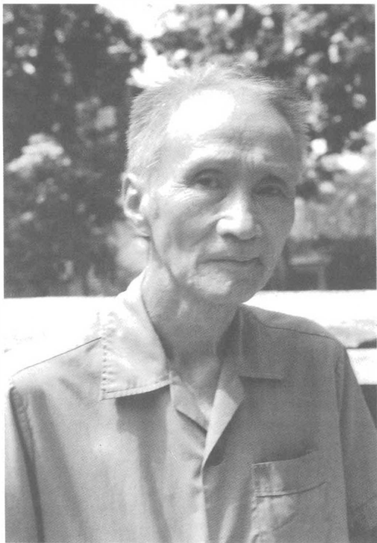
Nguyễn Khắc Viện (1913 - 1997)