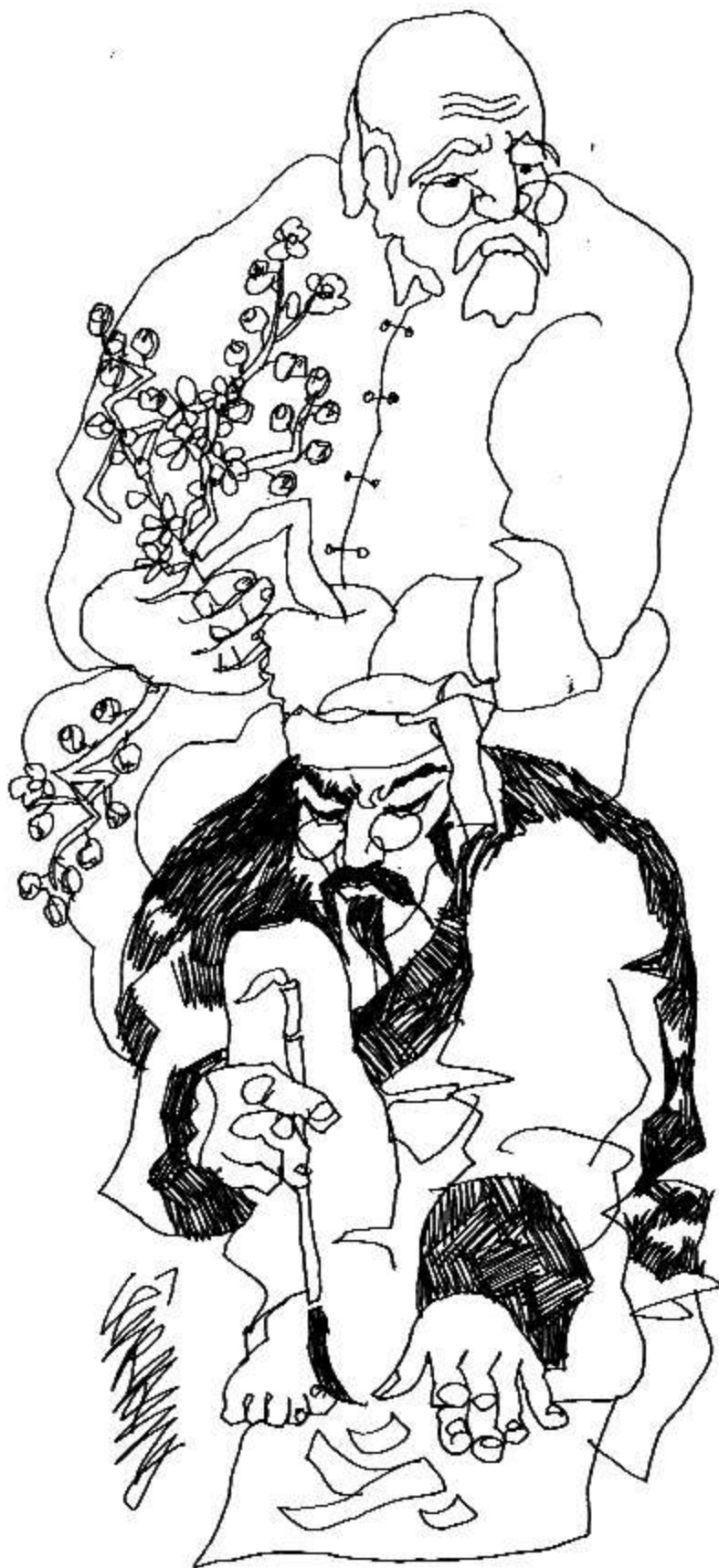
Minh họa: Lê Trí Dũng