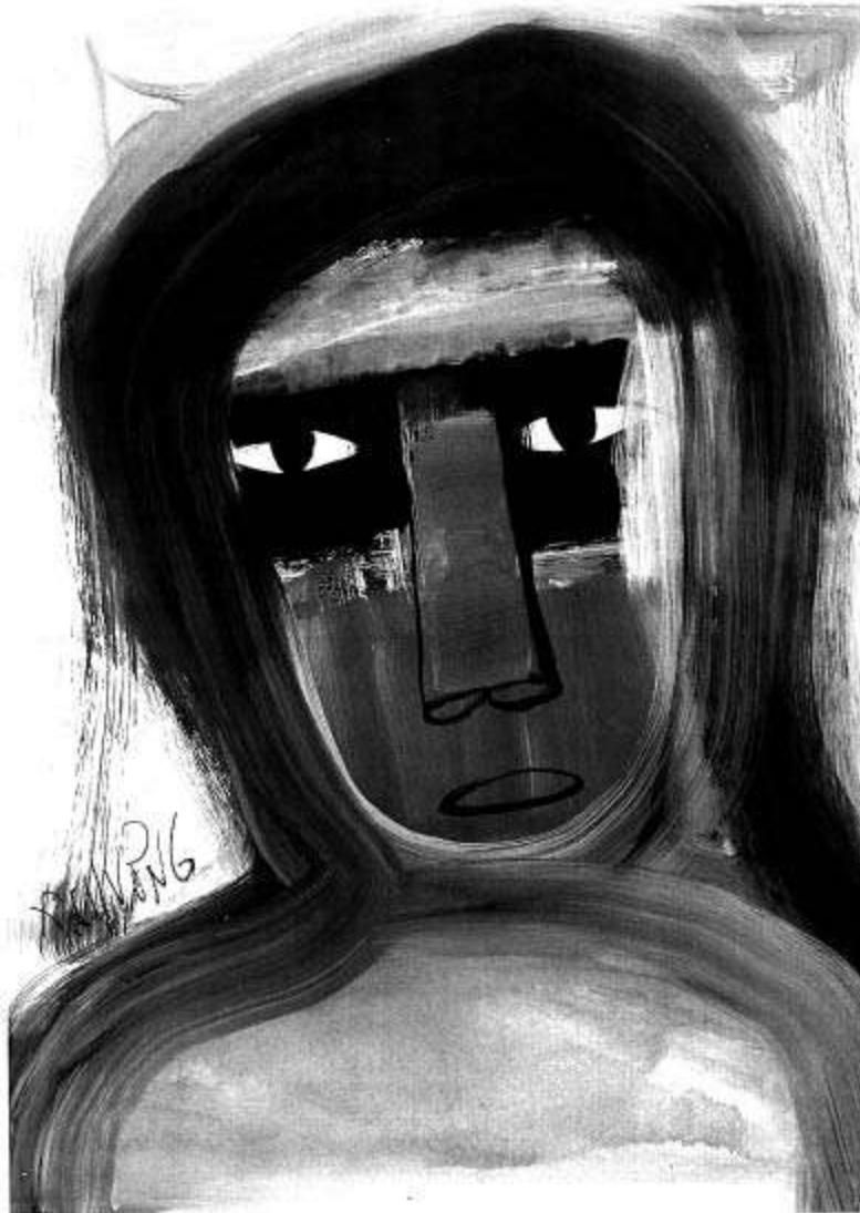
Minh họa: Thành Chương

Nàng đã không bỏ đi. Khi ông chưa kịp trấn tĩnh lại ông đã cảm nhận thấy một làn hơi ấm mềm mại lướt trên mặt mình, khi sự êm dịu ấy lướt xuống môi, xuống cằm, ông mở mắt ra. Không tin nổi: môi miệng nàng đang kề sát mặt ông, một nụ cười rạng ngời xuất hiện trong khi mi mắt nàng vẫn còn vương những giọt nước mắt.