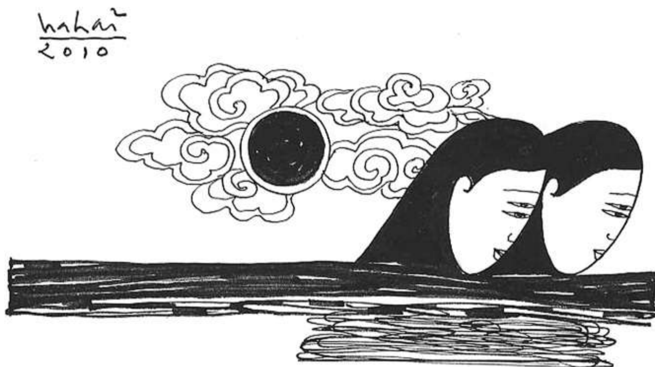
Minh họa: Hà Hải