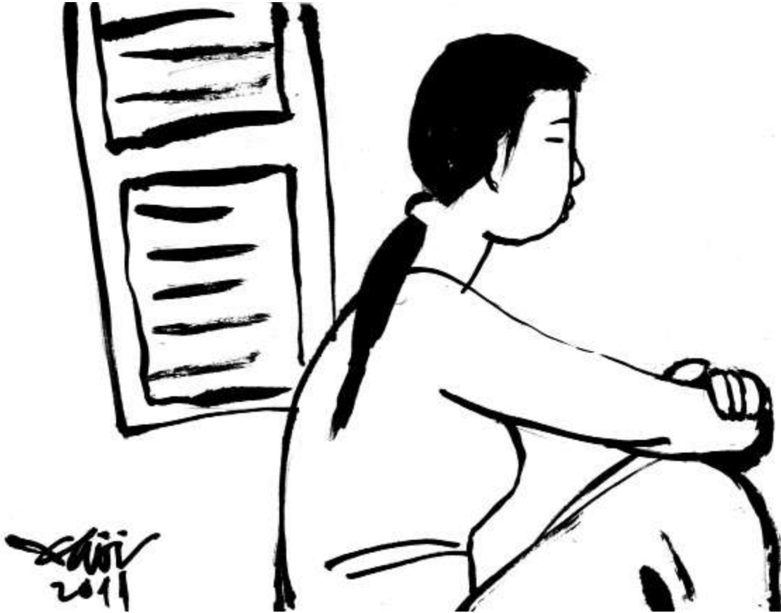
Minh họa: Phạm Minh Hải

Một hôm khác, sau khi hát xong, “mẹ” đột ngột buồn hiu: “San à. Bố con ghét đàn hát xướng ca biết bao. Ông ấy chỉ giỏi tán gái, cái mồm dẻo có chòi có chớp. Không thể làm sao lấy được vợ văn công...”