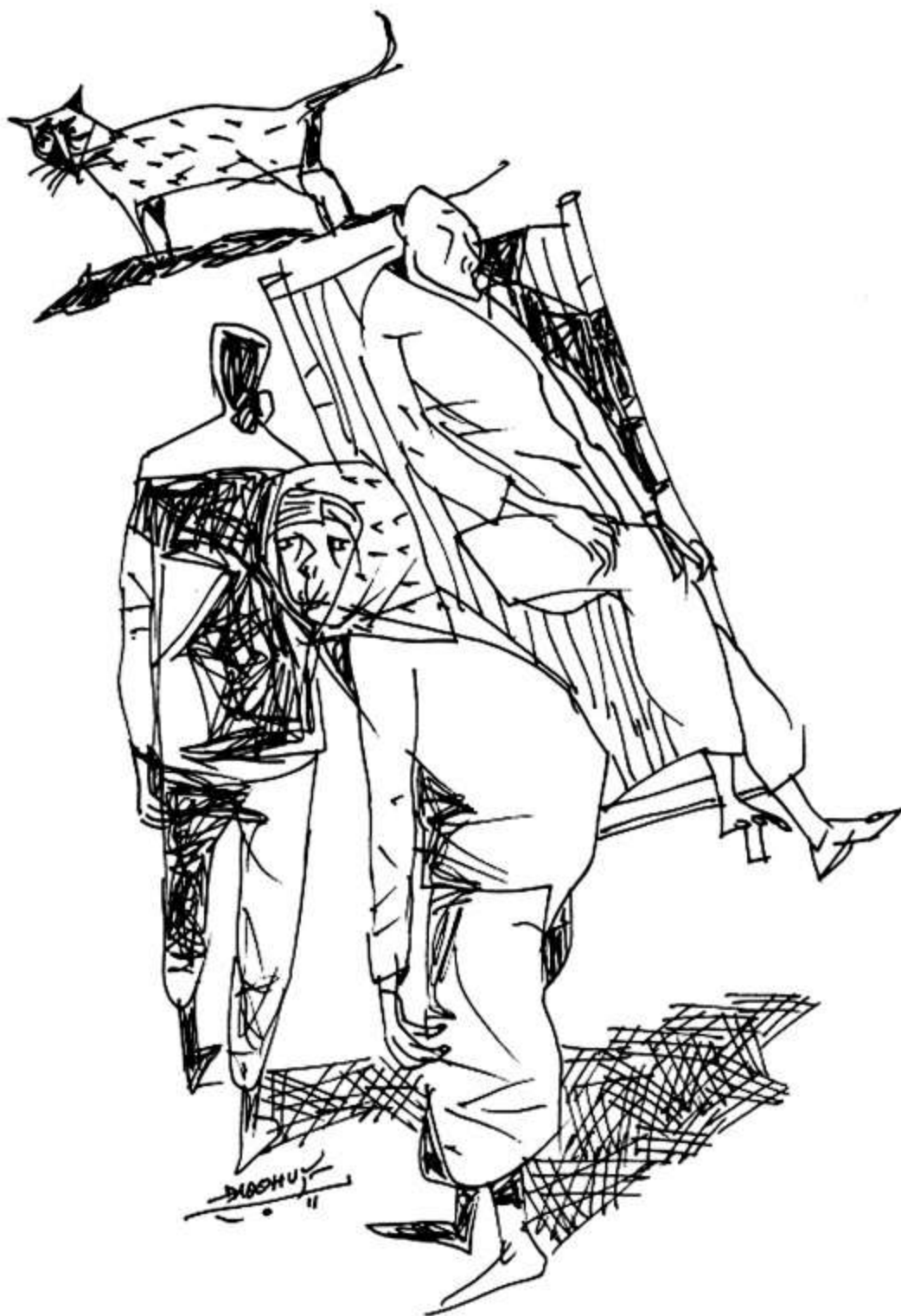
Minh họa: Đào Quốc Huy

Có tiếng động sột soạt phía bụi tre. Bà trộm mừng. Người ta muốn tạo bất ngờ cho bà ư. Anh ngỏ lời, biết đâu anh sẽ nói muốn mang bà về làm vợ. Bụng dạ bà xôn xang, bà nhắm mắt lại chờ đợi, bà giả bộ như không biết, không nghĩ ngợi gì cả, bà cúi xuống đưa tay khóa nước thành những vòng tròn duyên dáng.