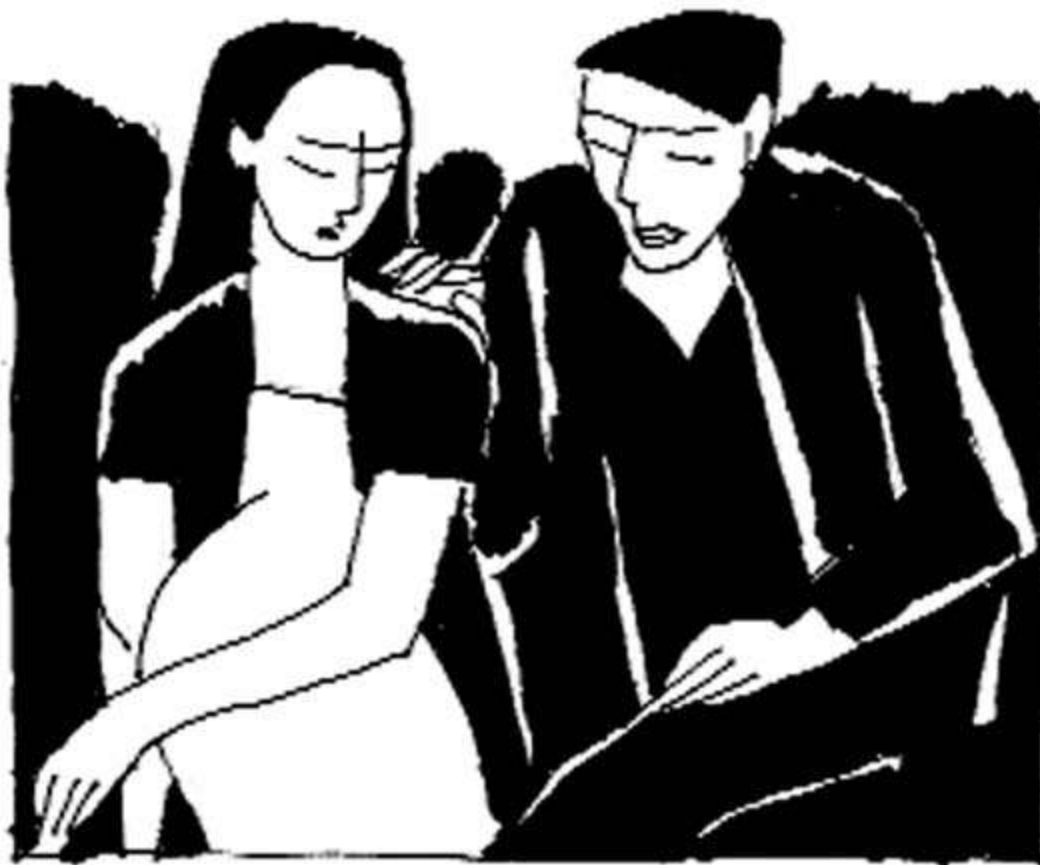
Minh họa: Phạm Minh Hải

- Về dưới đó mà sinh nở, tôi sẽ lo cả, đứa bé này nên để cha nó và tôi nuôi dạy. Em còn trẻ, nên tìm lấy một đám mà gả đi. Em biết đấy tôi không sinh nở được, chuyện qua thì cho qua.