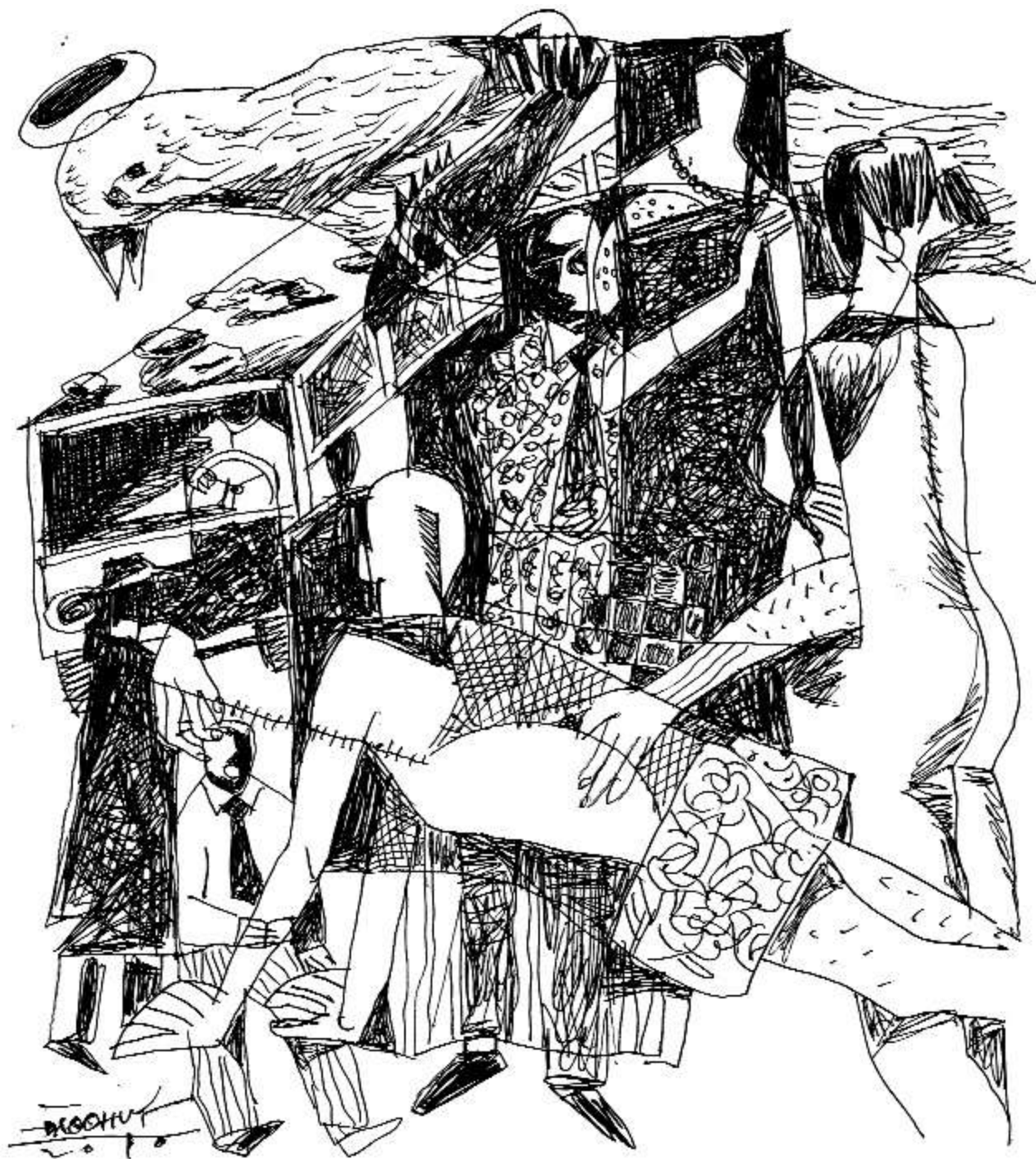
Minh họa: Đào Quốc Huy

Ra khỏi ga tôi bắt xe bus vào thị trấn. Lên cùng với tôi còn có người phụ nữ màu trắng. Trên xe không có ai. Hẳn giờ này mọi người đang ngồi ở nơi nào đó tránh nóng. Đàn ông nhâm nhi một li bia, phụ nữ là sinh tố hoa quả, trẻ con là kem vani.