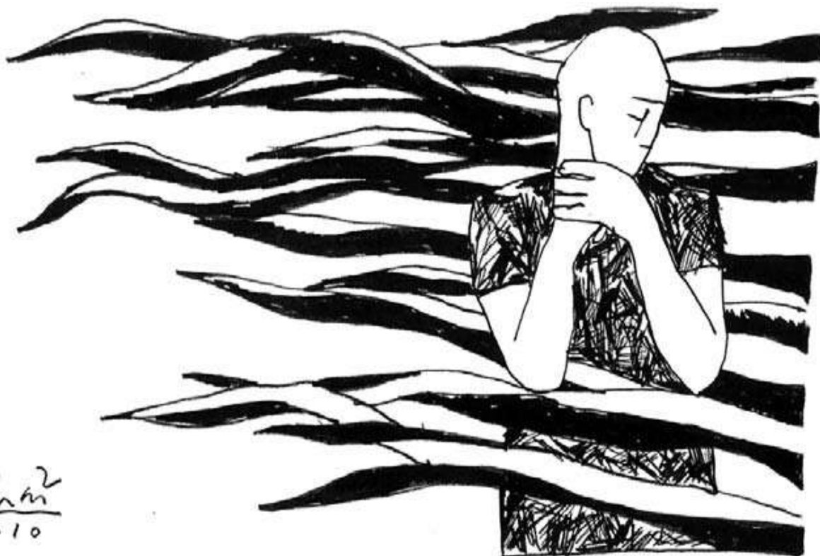
Minh họa: Phạm Hà Hải

- Mọi người im lặng, muốn biết đó là bùa gì phải hông? Thật ra đó không phải là bùa gì hết mà là chén thuốc... rầy! Ha... ha...!