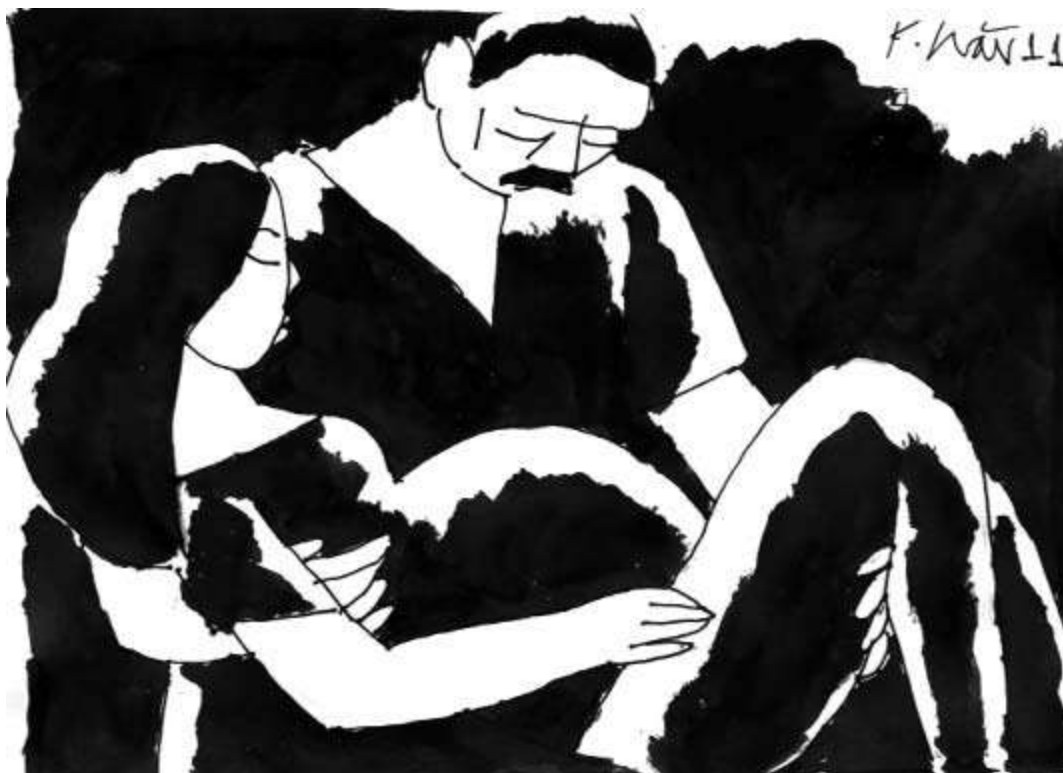
Minh họa: Phạm Minh Hải

Quảng xuống đất tờ hôn thú xé đôi do thằng con rẻ bỏ lại trong căn nhà trống hoác, ông gói ghém dùm cô mớ quần áo rồi dìu cô trở về. Cô khóc suốt chặng đường về đầy nắng. Thương mình. Giận mình. Rồi thương ông, giận ông lẫn lộn. Ông gá chi dùm cô nghĩa vợ chồng ngăn ngui mà đầy rẫy khổ đau. Ông có bắt cô ra khỏi ông chi rồi nặng trĩu đau đớn từng bước chân dẫu cô trở về.