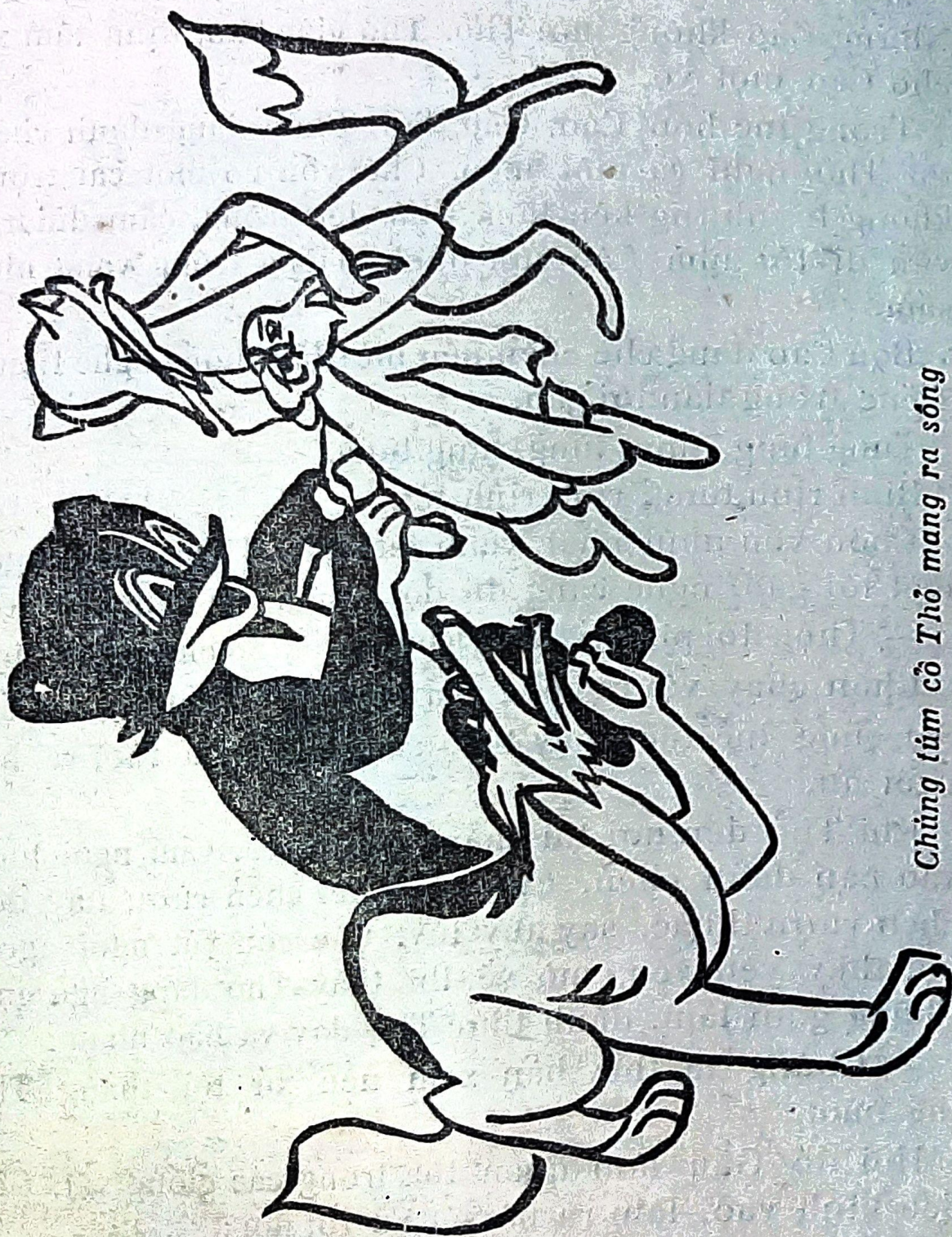
Chúng tôi cô Thỏ mang ra sống