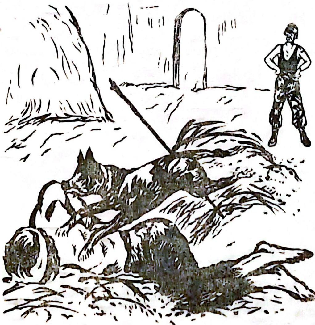
Con chó nhảy xỏ vào ông lão

Con chó bẹc-giê chồm lên người ông lão. Nó cắn loac ngay một miếng lớn nơi vai ông. Máu rơm rớm, trong nháy mắt đỏ loang, chảy ròng. Cắn xong miếng đầu tiên, con chó nhảy phắt ra nhảy vòn, sủa vang. Rồi đang chạy, nó đột ngột nhảy xỏ vào. Ông lão bị trói, vô phương chống chọi, chỉ chời đập hai chân và lắc lắc đôi vai. Nhưng ông lão cũng không kêu. Chỉ nghe ông thở khè khè, khi con chó dờp vào cổ ông, máu phun ra như suối.